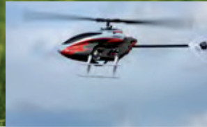
SAFE-Technologie SAFE technology