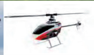
Collective Pitch Rotorsystem Collective Pitch System