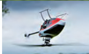
Rettungsmodus Panic Recovery Mode